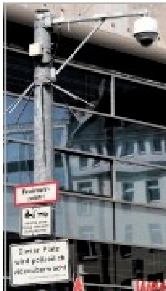
Videokamera der Polizei an der Konstablerwache

Die Frankfurt Polizei betreibt seit vielen Jahren vier Videoüberwachungskameras auf der Konstablerwache . Demnächst wird auch die Hauptwache von der Polizei überwacht. Der Wunsch, auch den Brockhausbrunnen und seine Umgebung zu überwachen, konnte die Polizei nicht durchsetzen.